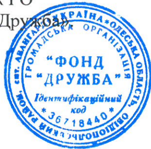
Мохд Осман Сід Рхаман